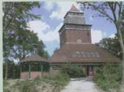
Waldmuseum im Aussichtsturm

Sanft geschwungene Hügel, gesunde Salzlufte, Wald und Wiesen, die Urlaubsregion rund um den Luftkurort Burg ist unbestritten die „Perle der Westküste“. Burg befindet sich direkt am Nord-Ostsee-Kanal,