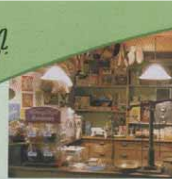
Kaufmannsladen im Burger Museum

Besuchen Sie das Burger Museum mit seiner Landapotheke aus dem 19. Jh., der alten Zahnarztpraxis, dem Kaufmannsladen usw. und lassen Sie sich in eine frühere Zeit versetzen, wo der Friseur sich in Notzeiten seine Trockenhauben von einheimischen Handwerkern basteln ließ!