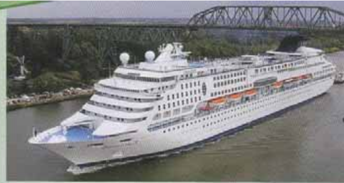
Traumschiff auf dem Nord-Ostsee-Kanal

wo Sie bei einem Spaziergang oder einer Fahrradtour Containerschiffe, Luxusliner und Segelboote vorbeigleiten sehen.