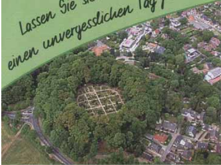
Ringwall aus dem 8. Jahrhundert

Lassen Sie sich einen unvergesslichen Tag planen!