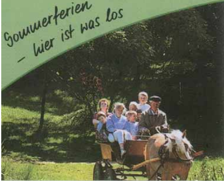
Wasser, Wald, Wiesen ... in Burg gibt's alles! Wo Schiffe durch die Wiesen gleiten ...