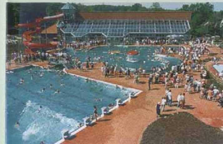
Beheiztes Freizeit- und Erlebnisfreibad

Angler, Wanderer und Reiter kommen in unserer Region ebenfalls voll auf ihre Kosten.